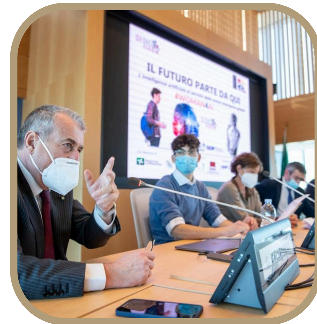
Presentazione IO SONO FUTURO (prima edizione), Regione Lombardia

Lancio terza edizione di IO SONO FUTURO ad ottobre '24